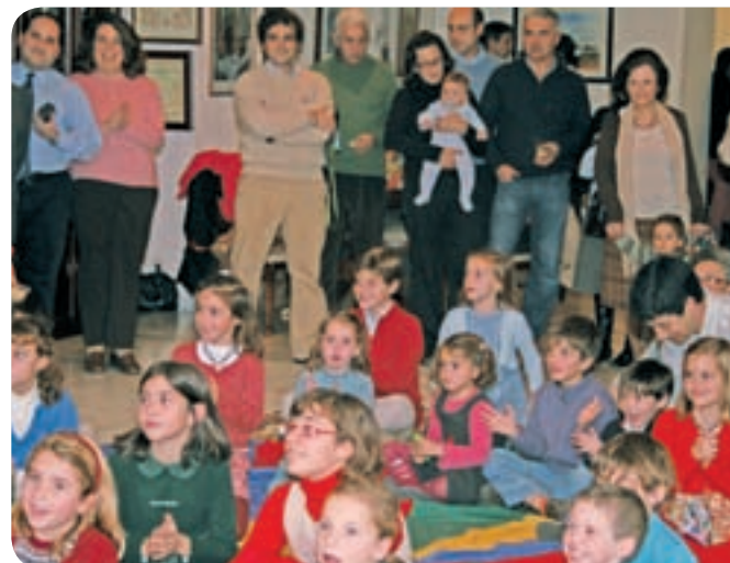
Los pequeños lo pasaron en grande con los payasos y malabaristas.