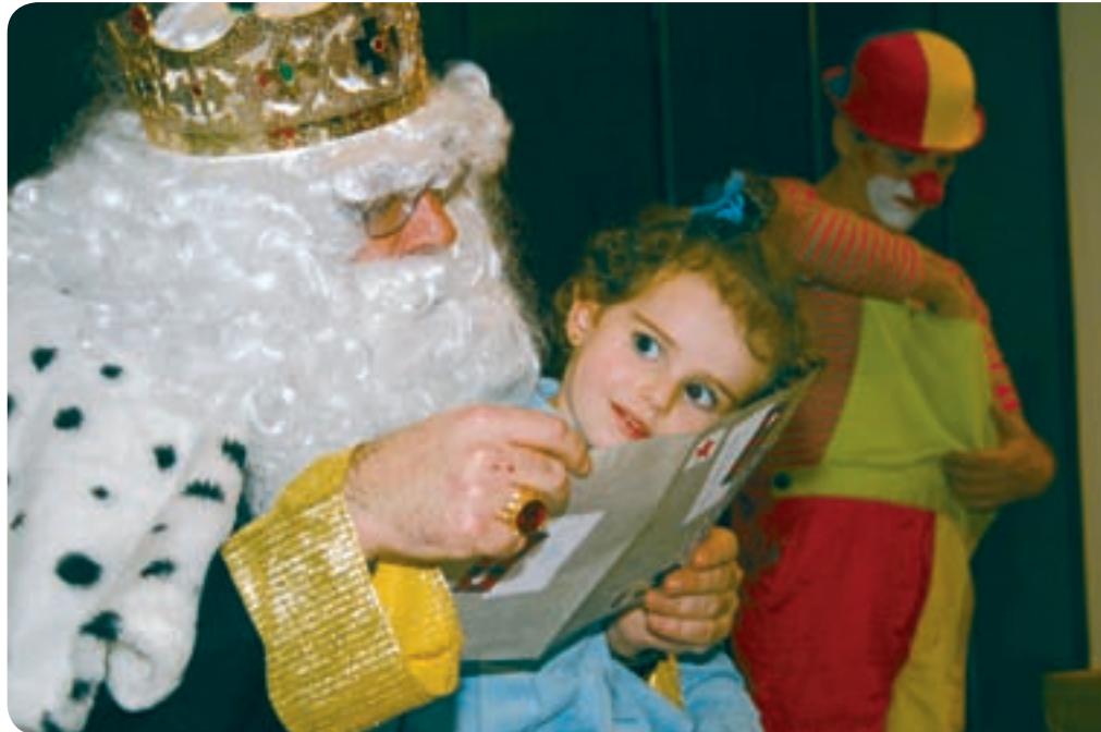
El rey Melchor con los niños en la sede del Colegio.

Tras el éxito del año pasado, este año no podíamos dejar pasar Las Fiestas Navideñas sin recibir la visita de una de sus Majestades de Oriente. Tras algunas gestiones, recibimos la confirmación de que este año nos visitaría el Rey Melchor y que estaba dispuesto a venir a recoger las cartas de todos los niños -y no niños- que tuvieran a bien entregárselas.