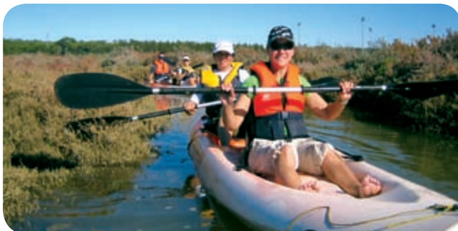
El paseo en Kayak por el río Piedras ha sido la gran novedad.