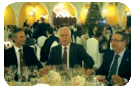
Momento de la Cena de Confraternidad.