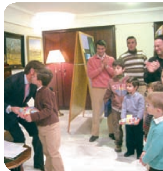
Entrega de premios de pintura, fotografías y tarjetas navideñas.