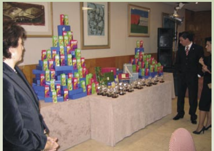
Montañas de regalos que se entregaron en la cena.

No descansamos pidiendo colaboraciones a bancos, laboratorios, empresas y cualquiera que el azar nos pusiera delante, para poder tener un pequeño obsequio a todos los asistentes. Y... qué bonita estaba nuestra gran pirámide de regalos, ¿verdad? Hubo, cómo no, un pequeño sorteo con grandes premios.