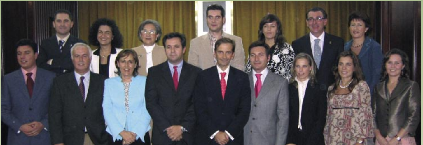
Nueva Junta de Gobierno del Colegio Oficial de Farmacéuticos de Huelva.