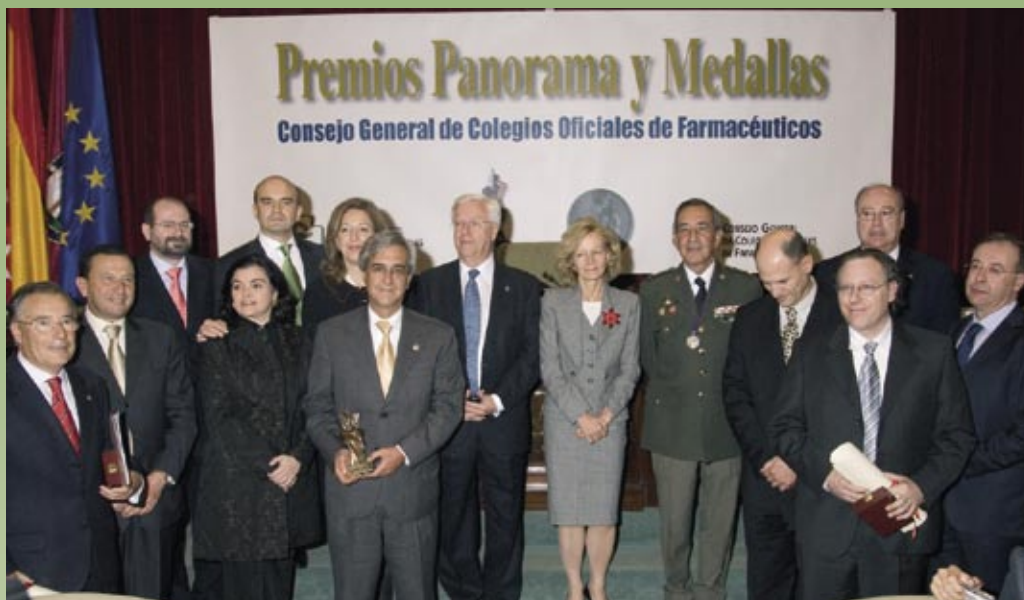
La ministra de sanidad, Elena Salgado, presidió el acto de entrega de los premios.