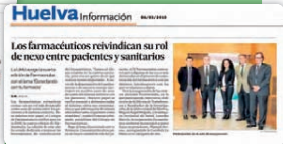
Huelva Información 06/03/2015