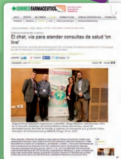
Correo Farmacéutico 09/03/2015