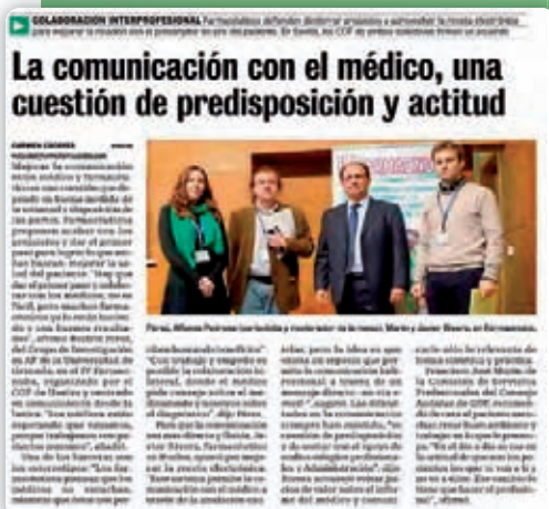
Correo Farmacéutico 09/03/2015