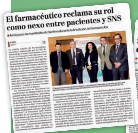
El Global 09/03/2015