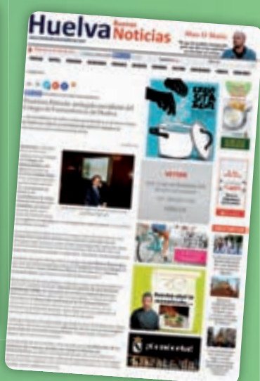
Huelva Buenas Noticias 29/04/2015